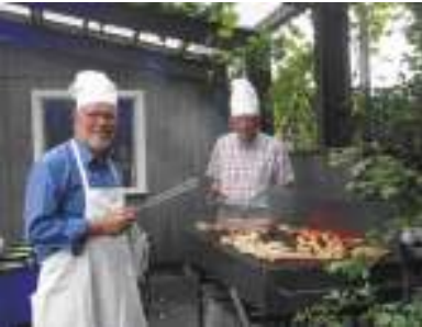
De gode grillmestre ved SAS Grill

Selvom mange er rigtig ”gamle” i klubben og har kendt hinanden i mange år, oplever man stor åbenhed og interesse for os nye.