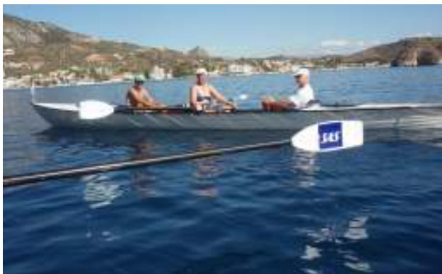
(”Skjold Viking” i Grækenland)

Vennerne af ”Skjold Viking” ( nogle af dem /red ) har meddelt bestyrelsen, at de ikke vil modsætte sig at roklubben siger farvel til Skjold, såfremt der bliver pladsproblemer i bådehallen, når vi nu får leveret en fin ny fire-årers til næste år. Bestyrelsen har taget meldingen til sig, og vil forsøge at finde et passende sted at anbringe Skjold.