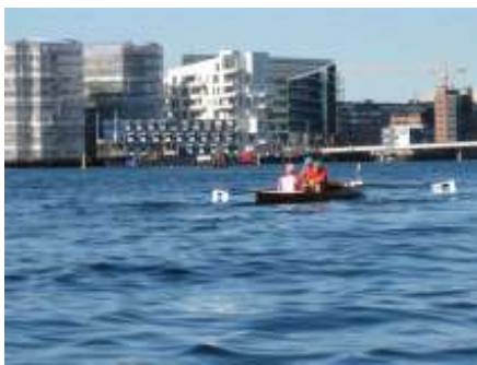
Billeder fra Amagerregattaen 2008